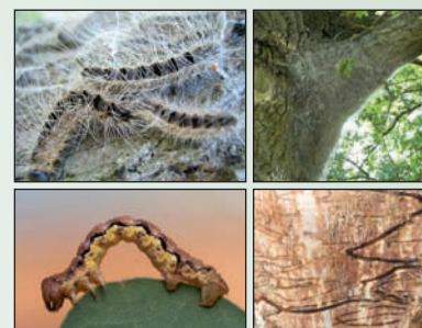
Larven und Gespinnst des Eichen-Prozessionsspinners (oben), Larve des Großen Frostspanners und Fraßgang des Zweifleckigen Eichen-Prachtkäfers