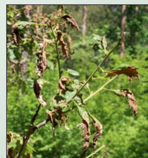
Die Eiche ist eine spätfrostgefährdete Baumart: Frostschaden an einer jungen Eiche.