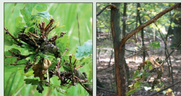
Wildschäden an Eichen: stark verbissener Eichentrieb (links) und Fegeschaden (rechts)