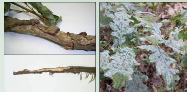
Von Mäusefraß (oben: Rötelmaus; unten: Erdmaus) und Mehltau sind Eichenkulturen besonders häufig betroffen.

Hinzu kommt die Eichenkomplexkrankheit, bei der abiotische und biotische Faktoren zusammenwirken.