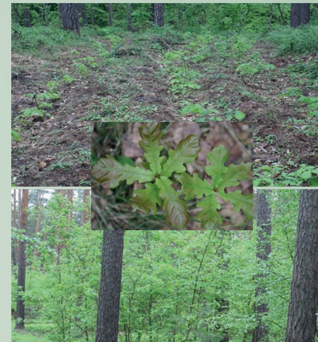
Eichenverjüngung per Naturverjüngung (Mitte), Voranbau (oben) und Trupppflanzung (unten)