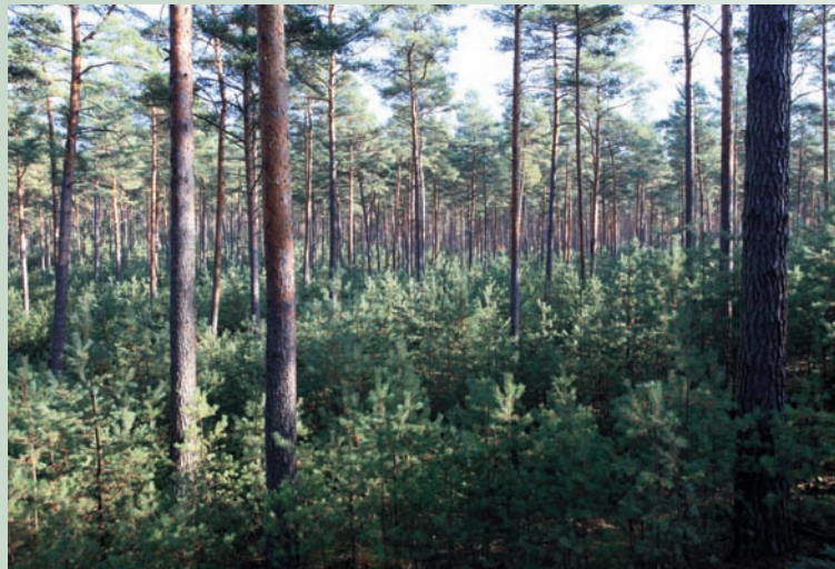
Gelungene Kiefern-Naturverjüngung nach Schirmhieb