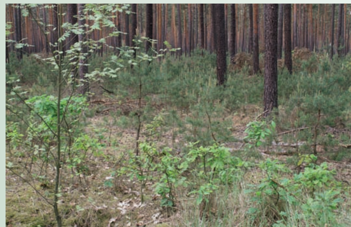
Kiefern-Naturverjüngung mit Laubholzbeimischung